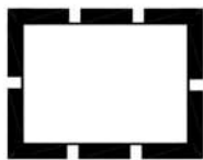
Grenze des räumlichen Geltungsbereichs des Bebauungsplans Leb 165 für SZ-Lebenstedt "Ehemaliger Güterbahnhof - West"