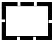
Grenze des räumlichen Geltungsbereichs des Bebauungsplans Leb 72, 4. Änderung für SZ - Lebenstedt "Fredenberg - Zentrum"