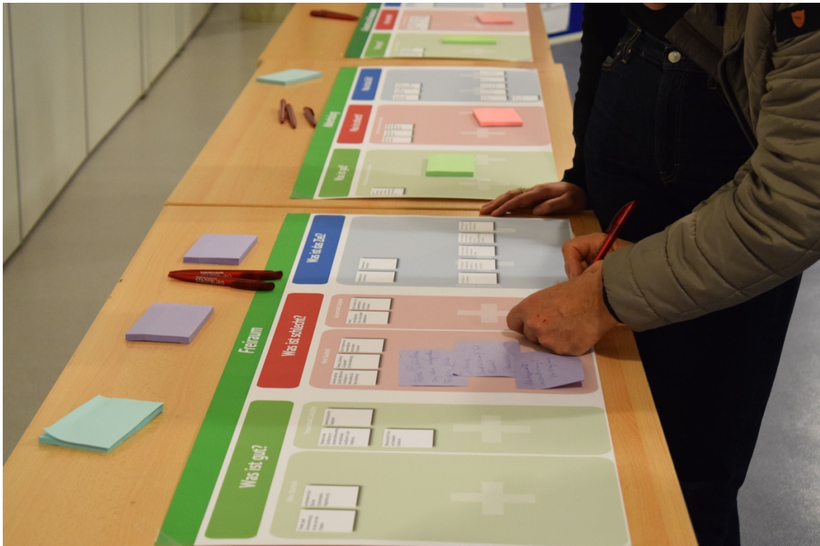
Eintragung eigener Hinweise auf einem Tischplakat