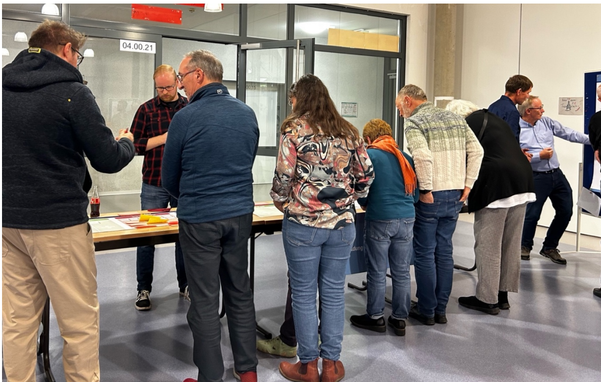
Gespräche im Werkstattbereich