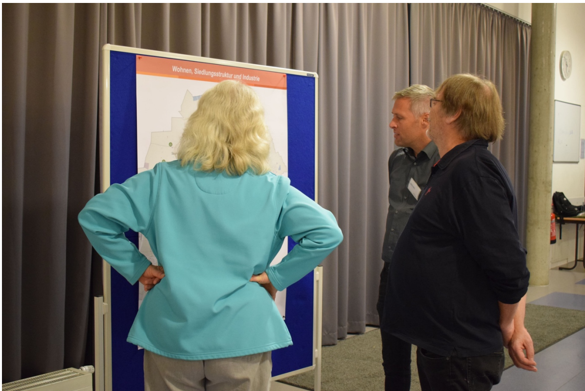
Diskussion am Kartenplakat