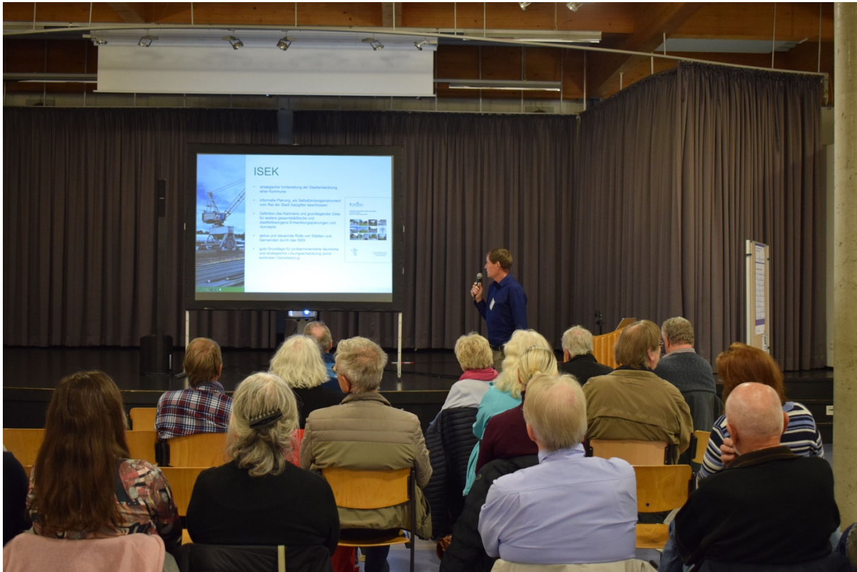
Einführung zum Hintergrund und zum Thema der Veranstaltung