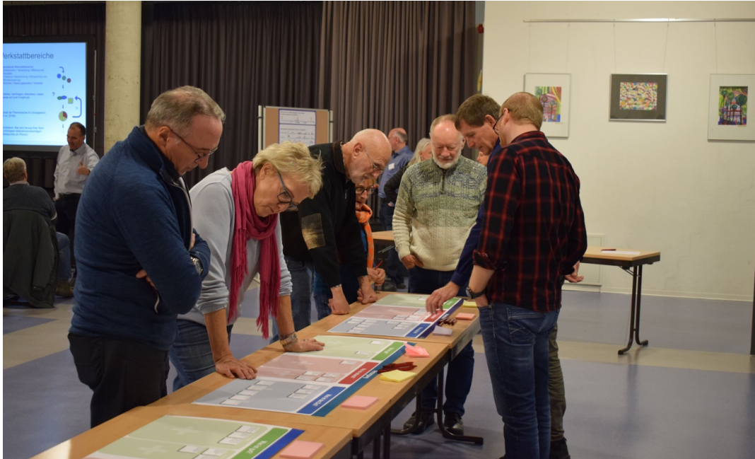
Arbeit an den Tischplakaten

Die Ergebnisse der Priorisierung sind auf den folgenden Seiten dokumentiert.